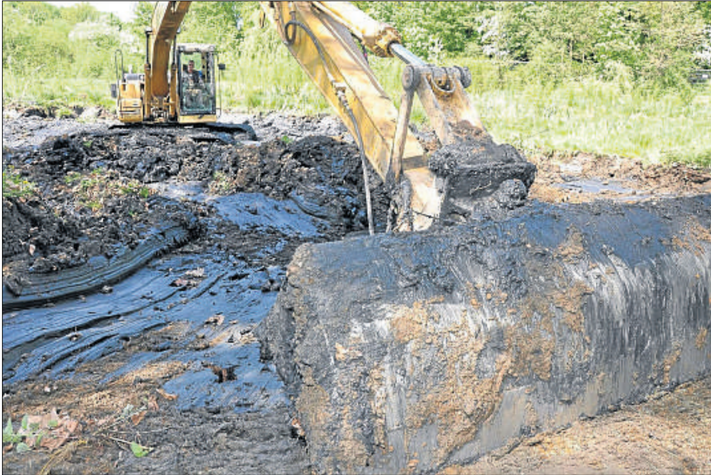
Bagger statt Fische: Etwa 350 Kubikmeter Schlamm täglich werden derzeit aus Teich drei im Park Schönfeld herausgebaggert.

Einen weiteren Kurs „Lebensrettende Sofortmaßnahmen am Unfallort“ bietet die Johanniter-Unfall-Hilfe am Samstag, 14. Mai, von 9 bis 16 Uhr in ihren Ausbildungsräumen, Glockenbruchweg 82, an. Anmeldung unter Tel. 9 40 43 10. (ste)